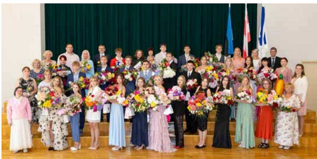
Suure-Jaani gümnaasiumi 78. lend.