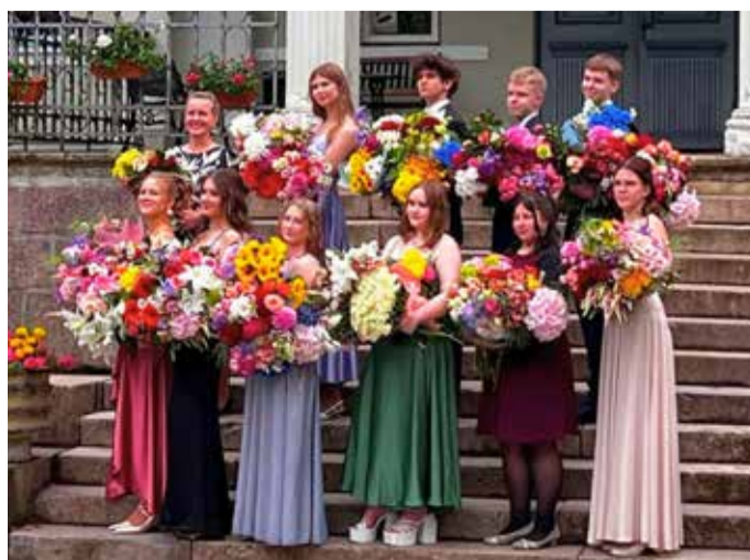
Kõpu põhikooli 104. lend.