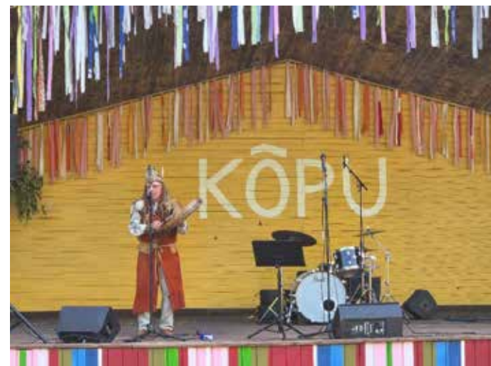
Edu Kuill Jaanikut sisse õnnistamas.