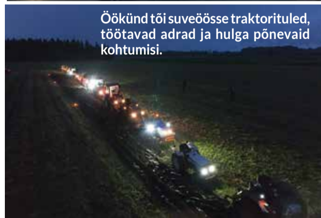
Öökünn tõi suveõsse traktorituled, töötavad adrad ja hulga põnevaid kohtumisi.