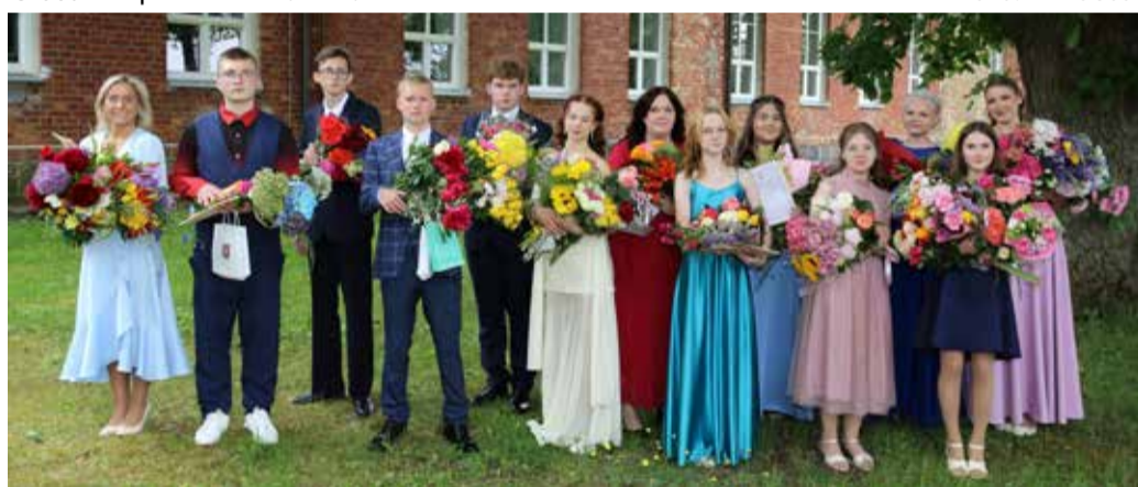
Kirivere kooli lõpetajad.