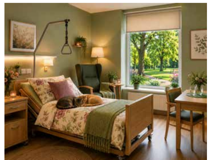
Illustratiivne sisevaade, mis annab ettekujutuse tulevaste ruumide võimalikust lahendusest. VISUAAL: TEHISINTELLEKT (AI)

Lõhavere ravi- ja hooldeskuse areng on oluline samm kvaliteetse hooldusteenuse pakkumisel ning asutus ootab nii tulevasi kliente kui ka uusi töökaaslast sellest osa saama.