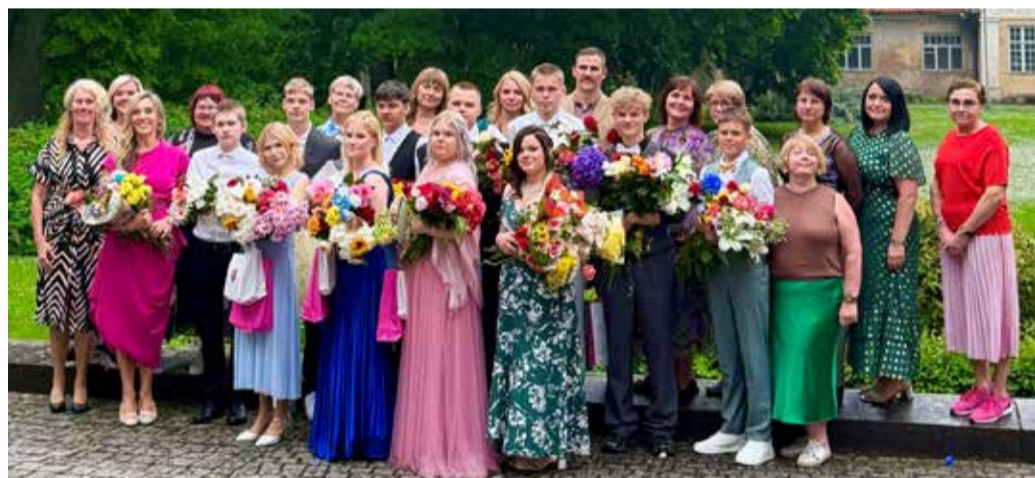
Olustvere põhikooli 27. lend.