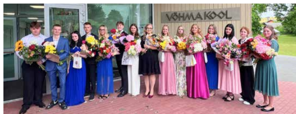
Võhma kooli 66. lend.