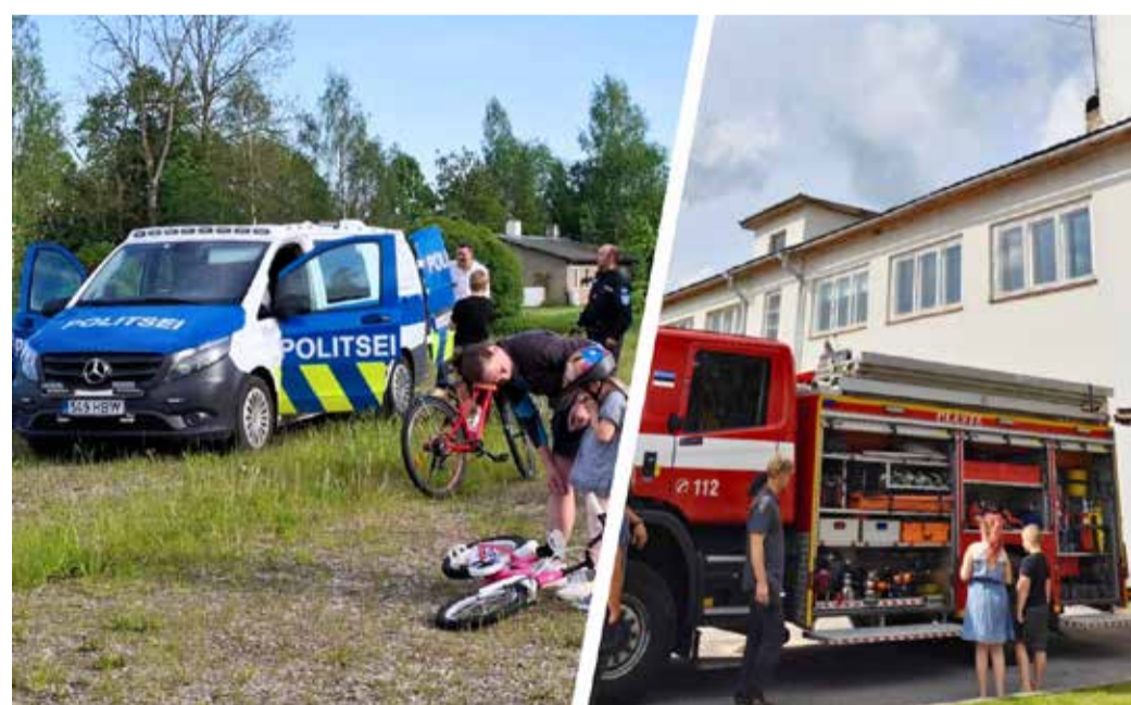
Politsei ja päästjad tutvustamas oma tööd ning varustust valla üritustel.

„Need tulemused peegeldavad tuhandete päästjate, häirekeskuse töötaja-