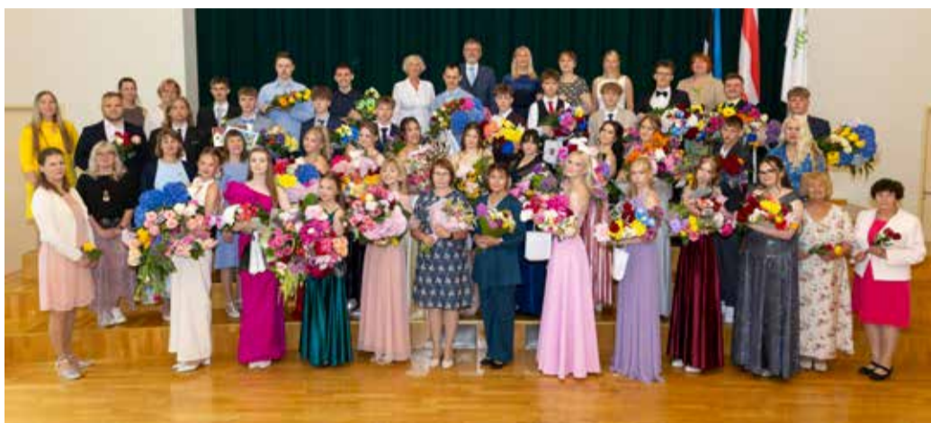
Suure-Jaani kooli 12. lend.