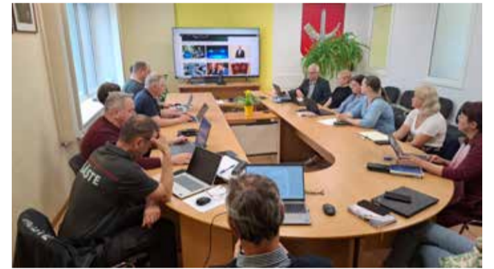
Põhja-Sakala valla kriisikomisjon lauaõppusel suurõppuse ILVES 2026 raames.

Õppuse käigus võisid vallakodanikud märgata tavapärasest aktiivsemat ametkondade teavitustegevust ja kriisiteemalist kommunikatsiooni. Tegemist oli õppuse osaga, mille eesmärk on harjutada koostööd ning avalikuse õigeaegset teavitamist erinevates kriisilukordades.