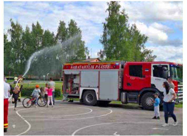
Lastekaitsepäeval käisid külas ka Kõpu vabatahtlikud päästjad.

Juuni esimene pool möödus Kõpu kooliperele kogukonna ja pidustuste keskel.