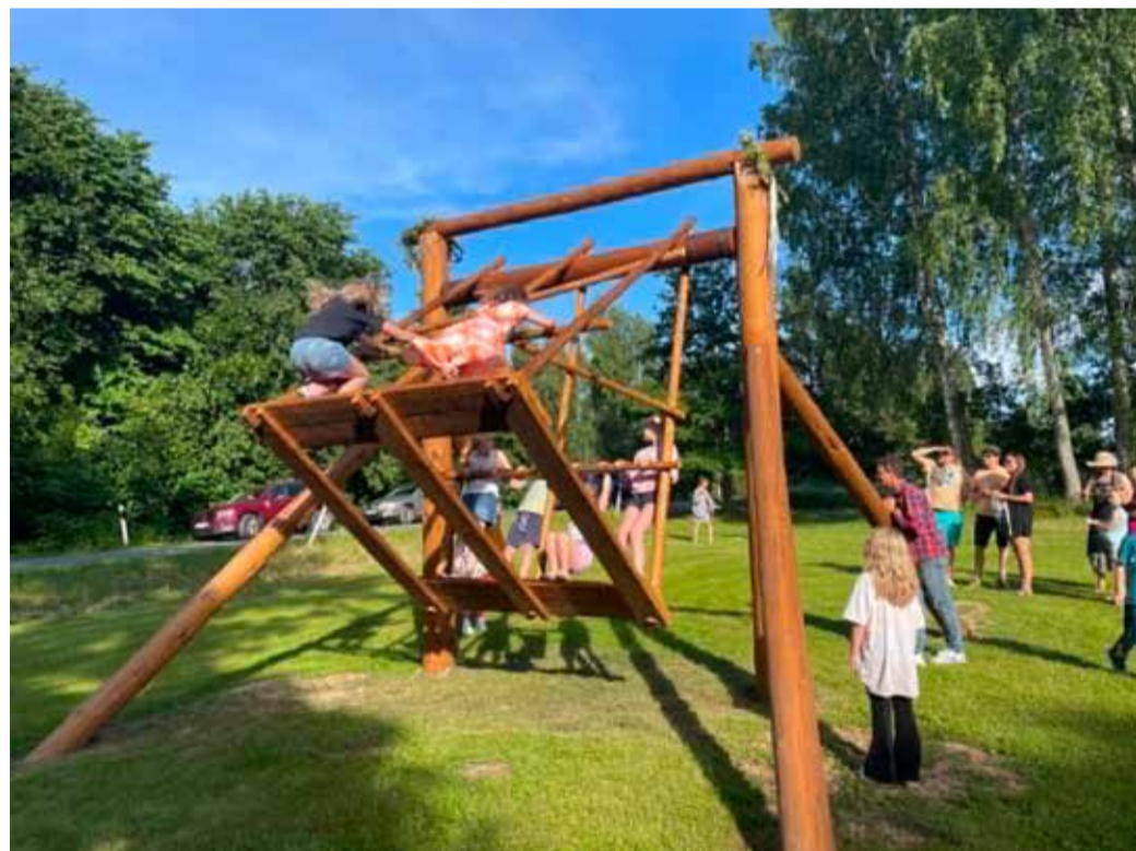
Kiigel oli õhtu otsa kõva hoog sees.