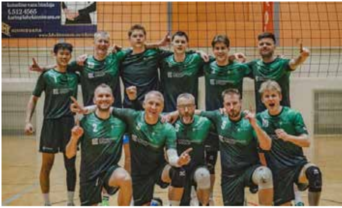
Võidukad võistkonnad: Combimill ja ...