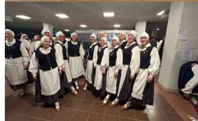
Pilgar ja naisrühm Suure-Jaani.