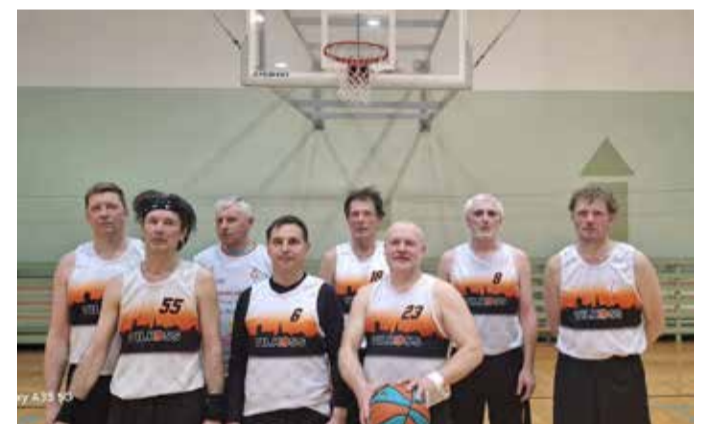
Põhja-Sakala 50+ võistkond.

Kohtume juba järgmisel aastal 44. Kõo-Pilistvere jüriöö teatejooksul!