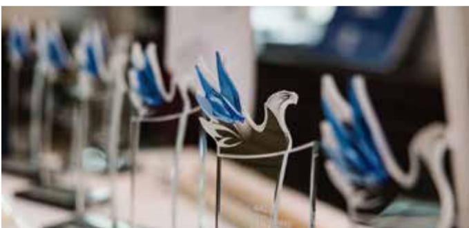
Aasta siseturvalisuse vabatahtlikele antav klaaskuju.

Naljatlades võib ju öelda, et killuke sellest tunnustusest kuulub ka meile – on ju meie kandilgi olnud oma roll tema kujunemisele. Palju õnne tunnustuse puhul ning aitäh tehtud töö eest!