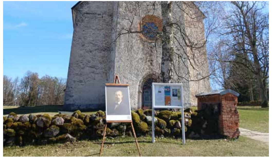
Autoportree – Suure-Jaani kiriku ees.

Projekti elluviimist toetavad Kohaliku Omaalgatuse Programm Viljandimaa ning Põhja-Sakala vald.