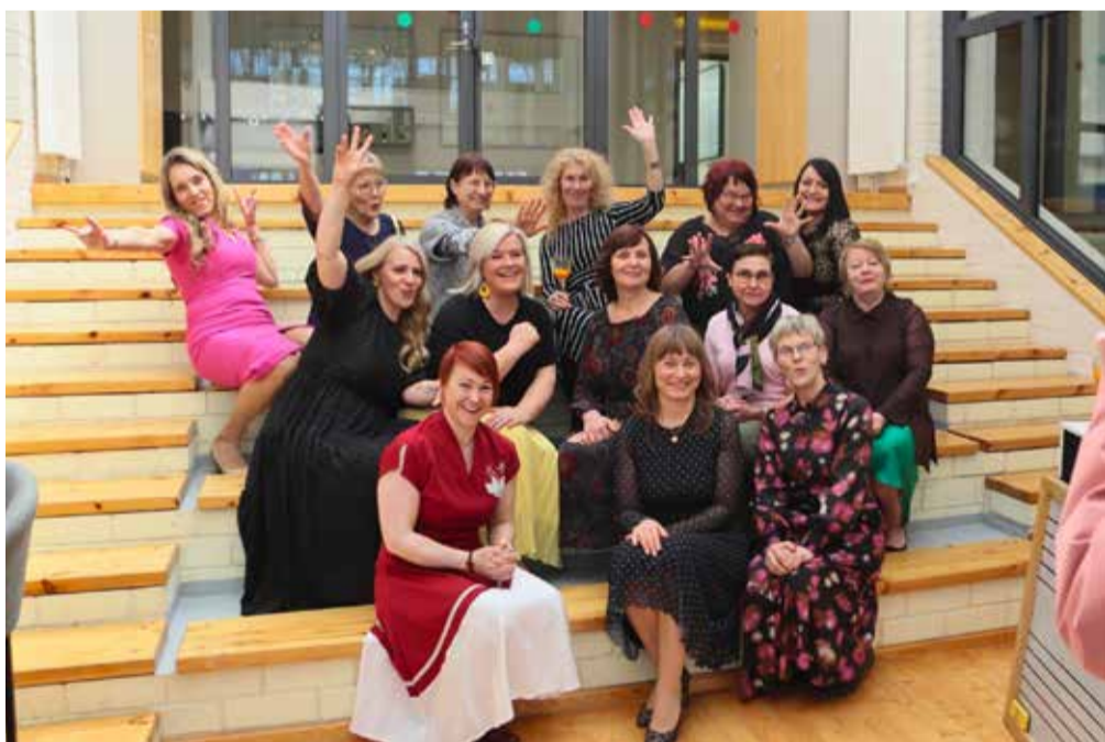
Olustvere kooli naispere – inimesed, kes hoiavad koolimaja südame tuksumas iga päev.

Vaata rohkem pilte avamis- sündmusest valla fotogaleriist: Olustvere kooli avamine.