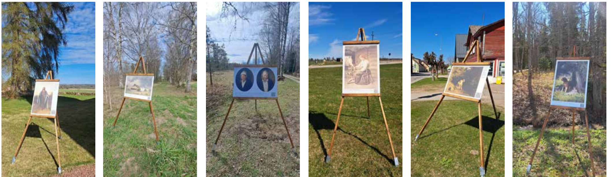
Fotodel (vasakult paremale): „Tulge minu juurde kõik“ – Kõpu kiriku juures; „Sünnikodu“ – Kööbral; „Ema“ ja „Isa“ – Lubjassaares; „Ketraja“ – Vastemõisas; „Tütarlaps allikal“ – Suure-Jaani keskuskes Tervisekoja lähedal; „Truu valvur“ – Suure-Jaani kultuurikeskuse pargis.