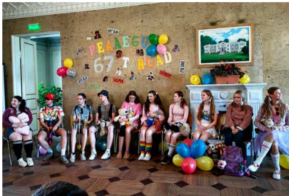
Kõpu kooli 9. klass tutipeol.

1. aprillil käisid kooli 2.–3. klassi ja 4. klassi võistkonnad Viljandi linnaraamatukogus kirjanduslikul mälumängul „Elas kord...“. Õpilased olid eelnevalt lugenud mitmeid Hans Christian Anderseni muinasjutte ning said oma teadmised proovile panna. 2. aprillil aga käisid kolm 9. klassi noort Olustveres Spelling Bee võistlusel. 2. aprillil oli ka koolipargis keskmisest rohkem sagi-