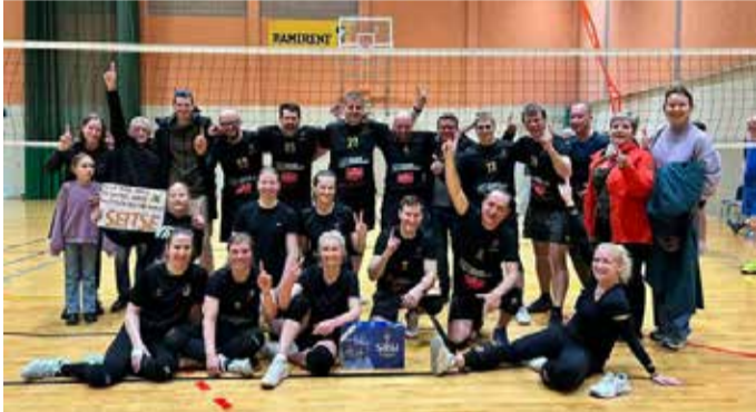
... VK Sei7se.