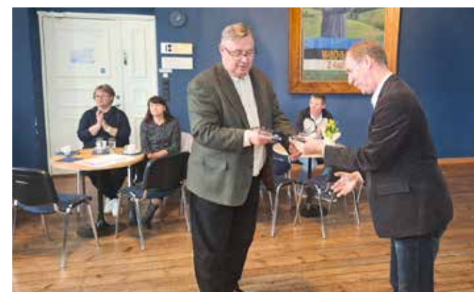
Altkäemaks korruptsioonikoolitusel? Õnneks mitte. Tegemist on Lahmuse kooli õpilaste valmistatud kellaga, mis kingiti vallale. Sama kool kinkis vallale juba 2018. aastal ka 100 inimese käsitööna valmistatud vaiba – koolijuhil soovil võiks kell leida kohta just selle vaiba juures.

meeldetuletust kui ka uusi teadmisi, mis aitavad igapäevatoös teha läbipaistvaid ja usaldusväärseid otsuseid.