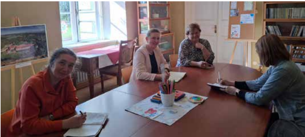
Kõpu piirkonna kohtumisel osalejad.

Aprillikuu teises pooles toimusid selle aasta esimesed piirkondlikud kultuurikohtumised, mis on kujunenud heaks traditsiooniks Põhja-Sakala vallas. Kohtumised leidsid aset Kõpus, Täaksis ja Paala rahvamajas, tuues kokku kohaliku elu edendajad, kultuuritöötajad ning kogukonnaliikmed.