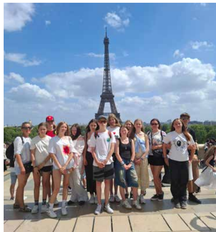
Kõpu noored Prantsusmaal Pariisis.