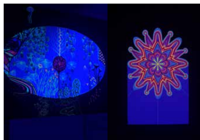
Nautida sai UV-valguses säravat kunstinaütust.