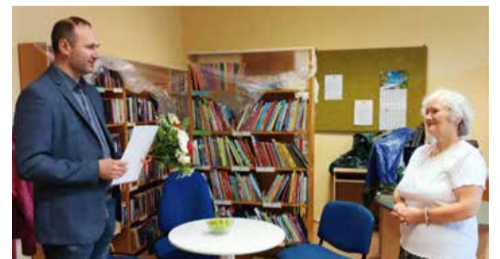
Vallavanema täanukirja üleandmine.