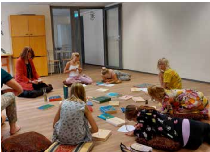
Lastega raamatut tegemas.