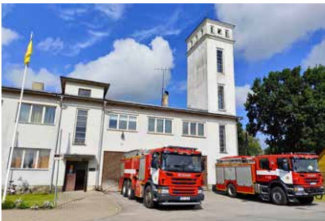
Muuseumil olid põnevad külalised.