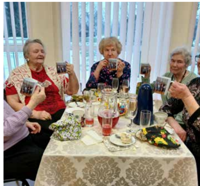
Klubiliikmed said sellised vahvad kruusid.