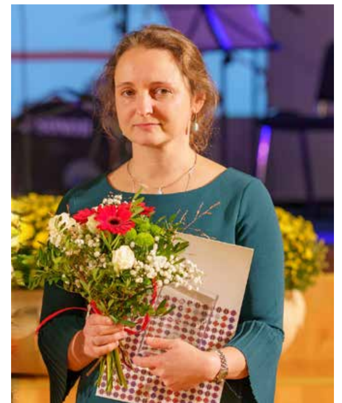
Jelena valla hariduspreemiate jagamisel 2023. aastal.