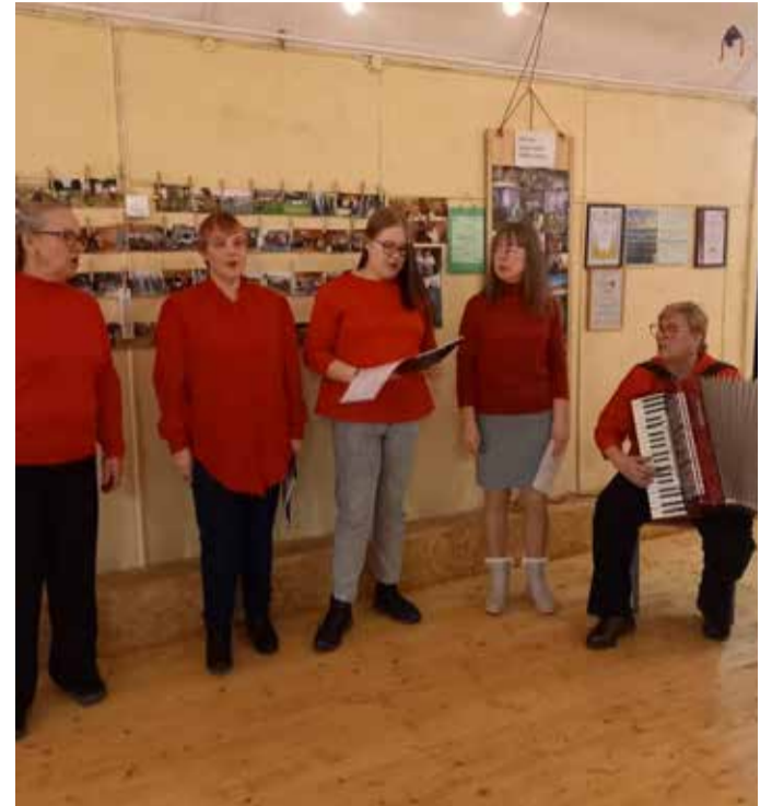
Pereansambel Üks väike rõõm.

Koksvere asukoht mitme maakonna piiril toob peole külalisi nii lähedalt kui kaugemalt. Uue aasta tervitamise peol olid uuteks tulijateks Imavere ja Kehtna inimesed.