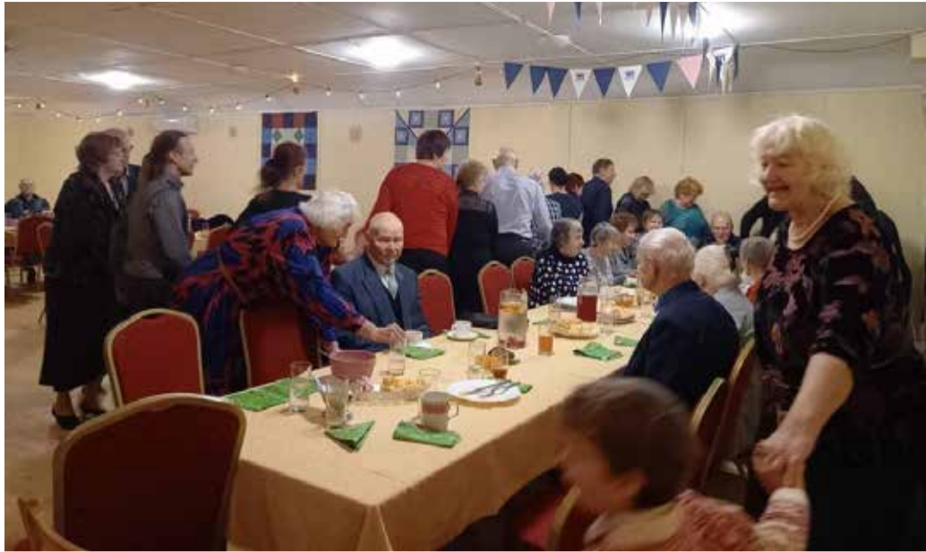
Sabatants laudade vahel.

Peo muusikalise poole eest hoolitses Imavere pereansambel Üks Väike Rõõm, kes laulis üle kahe tunni nii tantsude vahepeal kui ka tantsuks. Saalitäie rahva liikuma saamiseks tehti alustuseks ka ringmängu ja sabatantsu, mis tõid kaasa palju elevust. Viieliikmeline pereansambel Maive