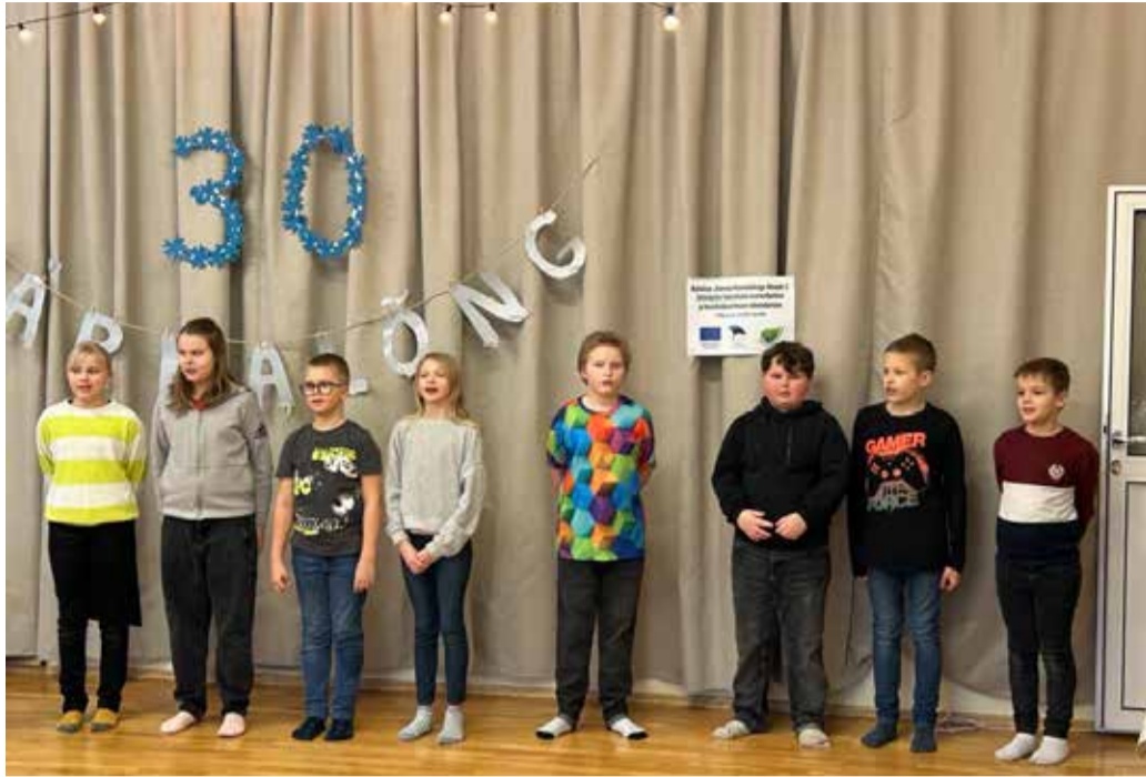
4. klass Härma Lõnga sünnipäeval.

Jaauaris tähistas oma 30. sünnipäeva meie paikkonnaka eakate seltsing Härma-