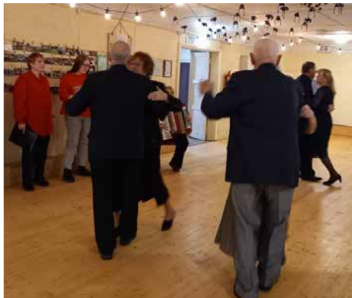
Esimesed tantsupaarid on pörandal.

Looritsa juhendamisel on kaasaahaarava esinemise tegutsenud alates 1996. ja kaunite laulude poolest. Vahepeal oli tege-