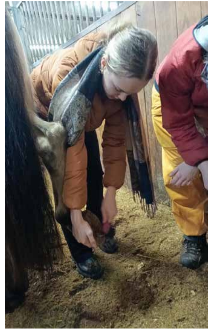
Töötoas räägiti kapjade hooldusest.

Võhma Kooli õpilased said praktilisi kogemusi Järvamaa Kutsehariduskeskuses