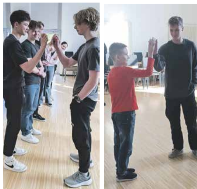
Koks, koks, koks... See on munapoks.