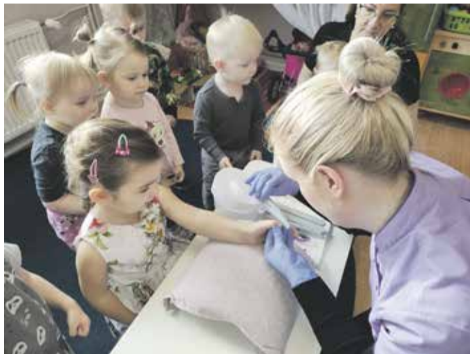
Meie kõige väiksemad manikööri järjekorras.