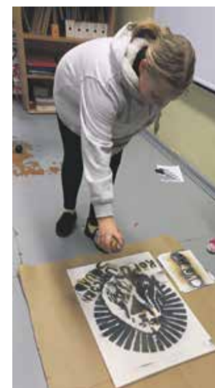
Nii valmis Kõpu Unicorn Squadi logo.

Märtsi keskpaigas alustas Kõpu koolis koostöös HK Unicorn Squadiga tüdrukute tehnoloogiaring Kõpu Unicorn Squad. HK Unicorn Squad on liikumine, mis pakub huviharidusena tehnoloogia-õpet ainult tüdrukutele. Liikumise eesmärgiks on kasvatada 8–14-aastaste tüdrukute seas praktiliste ja põnevate ülesannete abil huvi tehnika, robotika ja loodusteaduste vastu.