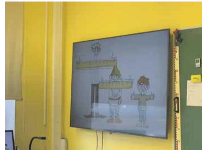
Visuaalne näide selle kohta.

sest täna rääkis ta naeratus näol oma üleelamistest. Aigari sõnul aitab positiivne suhtumine ja tegutsemine paranemisele palju kaasa. Jaanuaris kõndis ta karkudega 188 kilomeetrit, Haapsalus ravil olles proovis talisuplust. Ka tulevikus ei soovi ta lihtsalt laua taga istuda. Äärmiselt