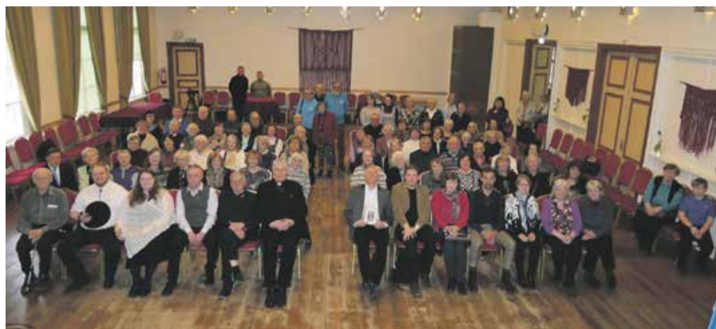
Mälestuspäev tõi kokku saalitäie rahvast.