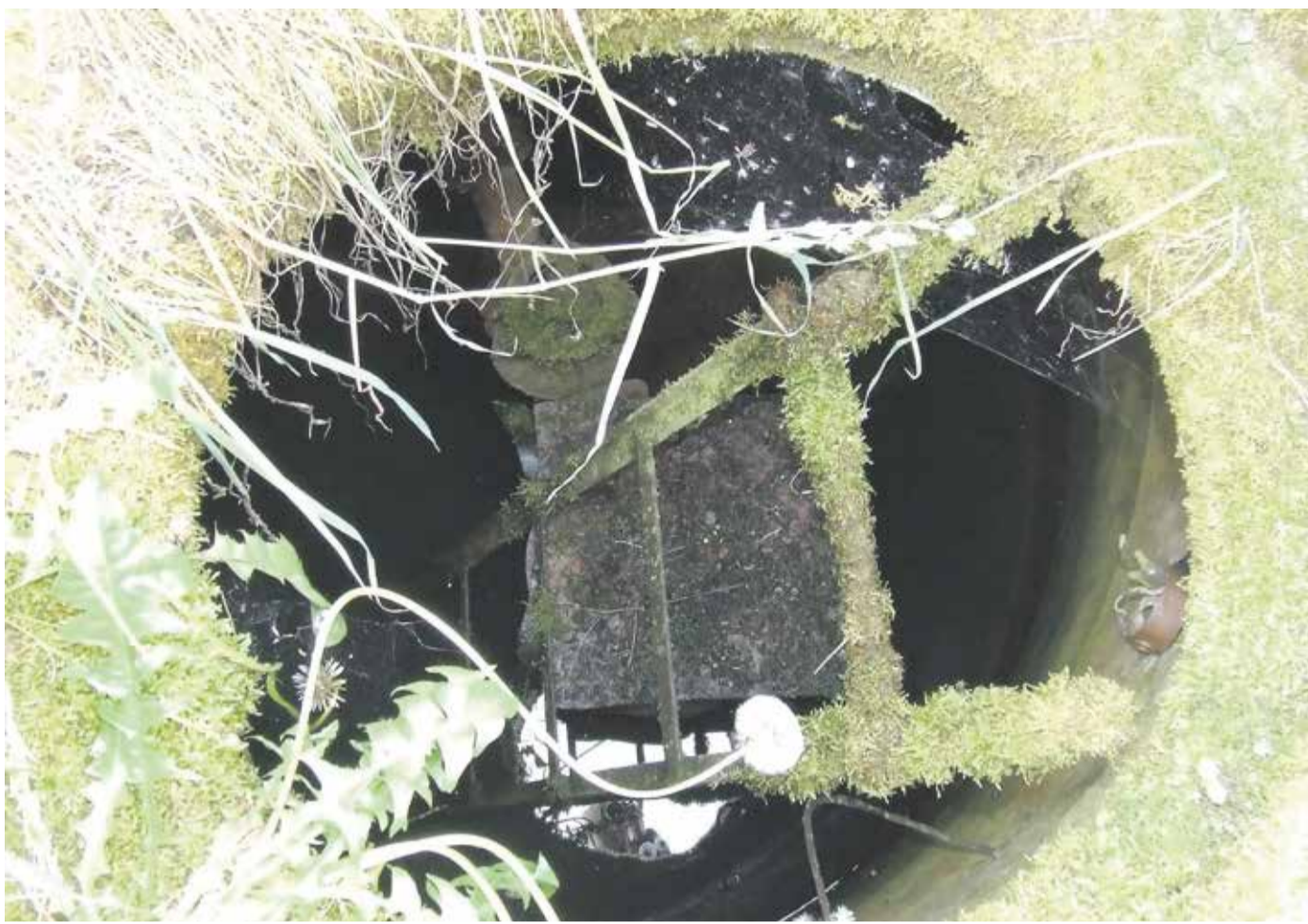
Korrast ära kaev.

• Geofüüsikalised meetodid võimaldavad kontrollida puurkaevude konstruktsiooni, juhtides kaevu sonde, elektrilisi signaale või laineid. Näiteks kavernomeetria on meetod, kus puurkaevu viidud sond mõõdab üles kaevuõones esinevad õnarused ja kitsused, võimaldades suhteliselt suure täpsusega määrata puurkaevu läbimõõtu selle eri osades, manteltorude paigaldussügavust, nende ühenduste asukohti ja ka kvaliteeti. Kivimite tiheduse mõõtmise geofüüsikaline meetod võimaldab puurkaevus määrata kivimikihtide lasuvuspiire ja hinnata manteltorutaguse isolatsiooni kvaliteeti.