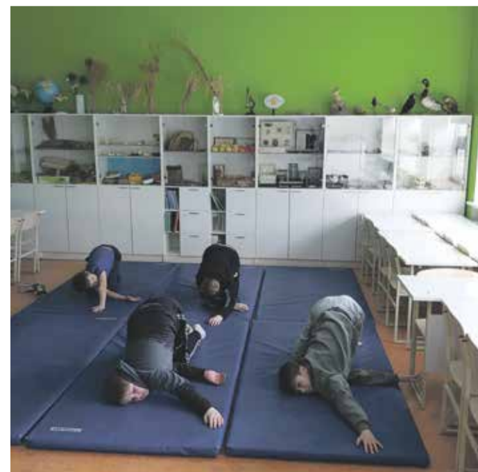
Joogapoisid turgutavad füüsilist ja vaimu.