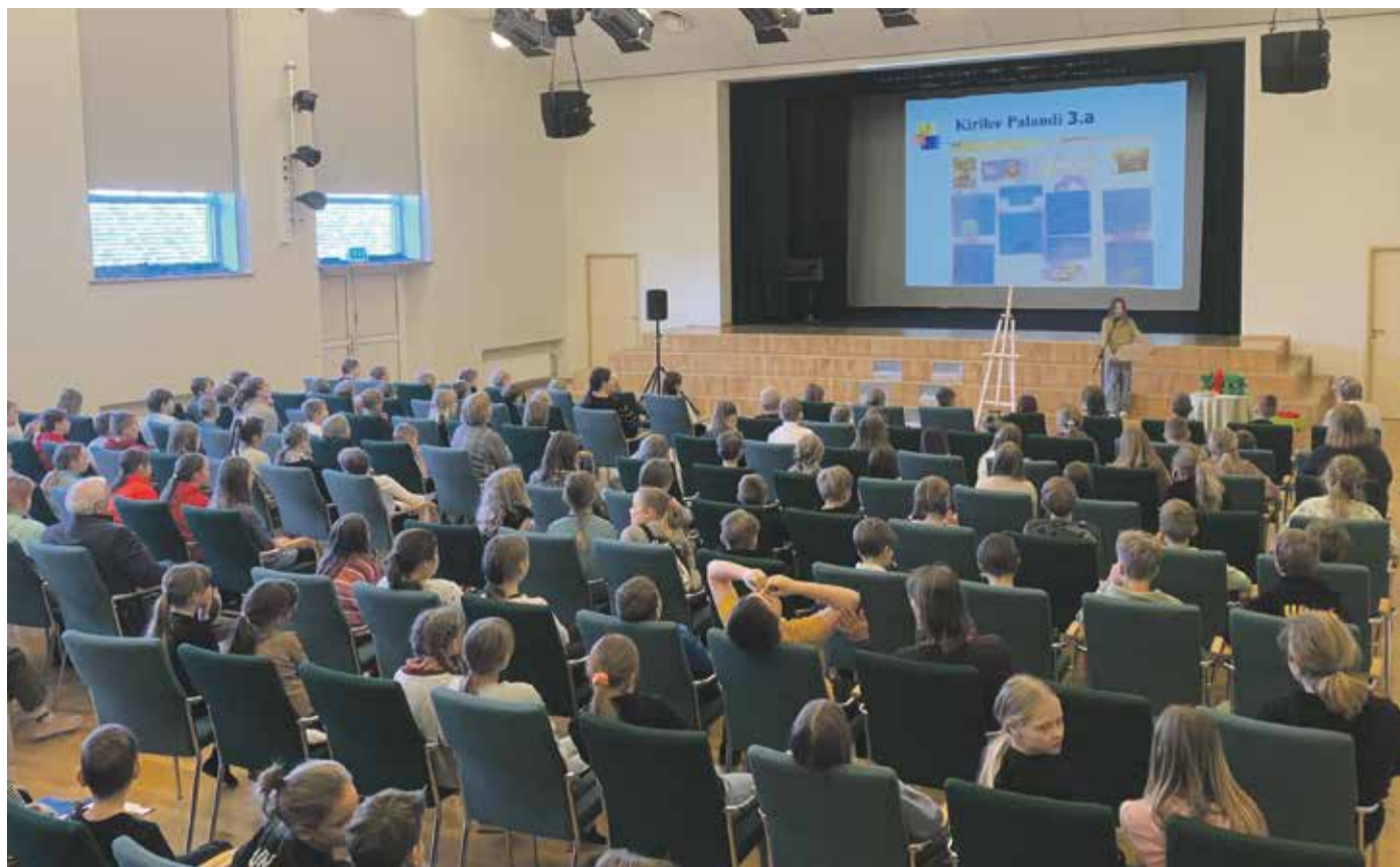
Uurimistöde esitlusi kuulati huviga.