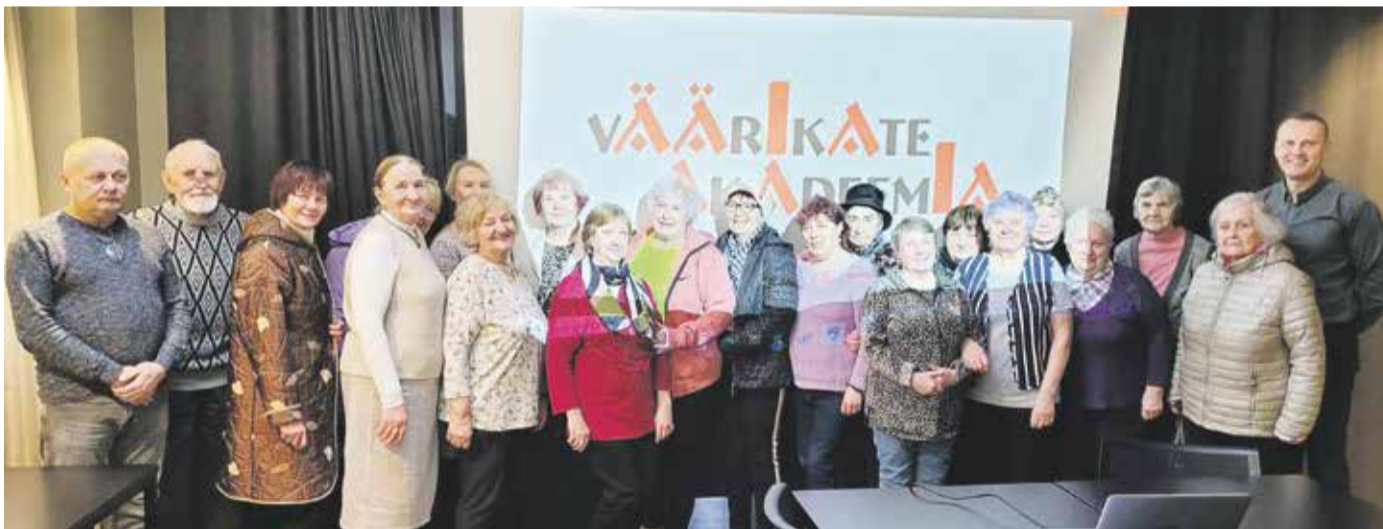
Akadeemia algatuskoosolekust osavõtjad.