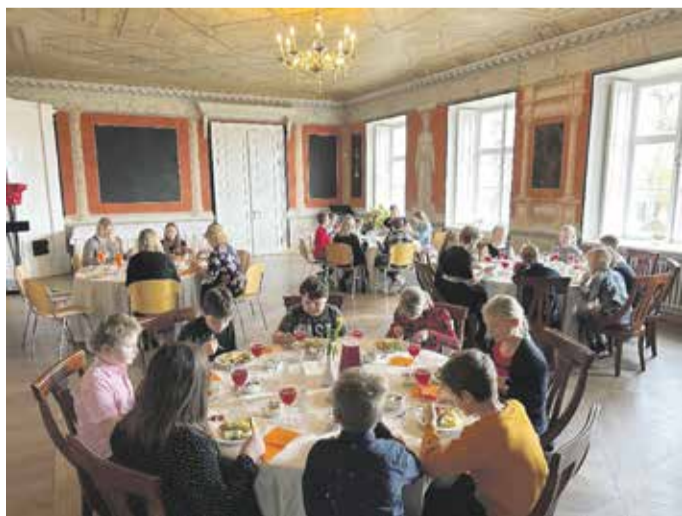
Pidulik lõuna mõisa söögisaalide valmistamise tunni.

15. märtsil esindas 6. klassi õpilane Karoliina Vähi meie kooli maakondlikul ortograafiavõistlusel.