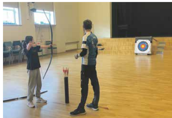
Kes soovis, sai kätt proovida vibulaskmises.