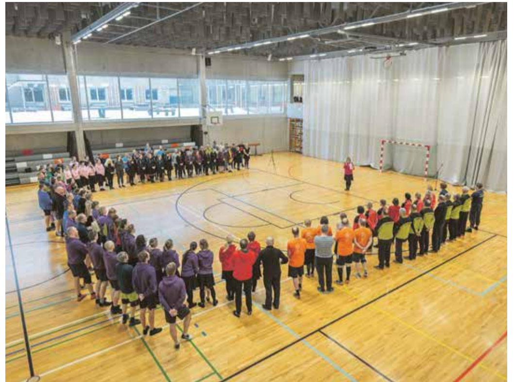
Tegus päev sai teoks Õerutajate eestvedamisel ja Põhja-Sakala kultuurikeskuse kaasabil. Sügav kummardus ja kiitus tegijatele ning osalejatele!