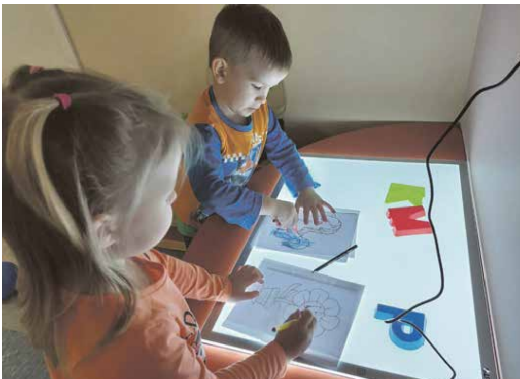
Lapsed valguslauda võimalustega tutvumas.

Kohalik ettevõtte Combimill kinkis lisaks laada ajal välja loositud meenetele lastele uhke valguslauda. Viimast saab kasutada õppekasvatustöö mitmeke-