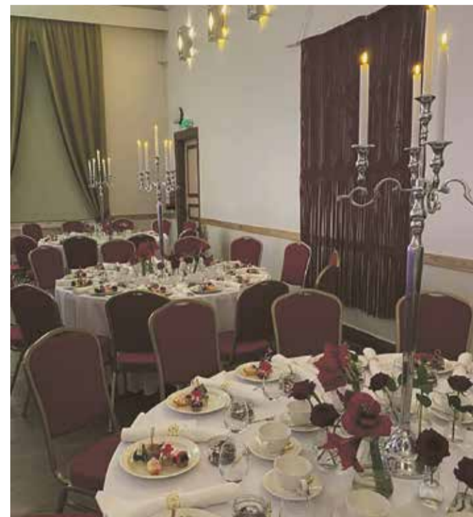
Tänu südamest, Venevere puhkeküla! Kõik oli suurepärase – kena serveering, hõrk ja väga kaunis toit.